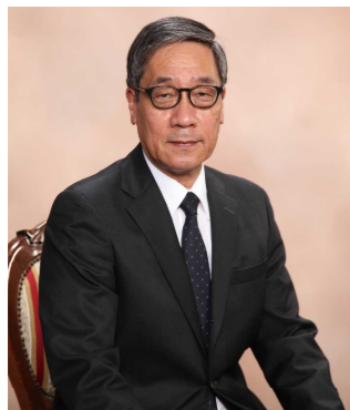
協議会 会長 (奈良女子大学 学長)